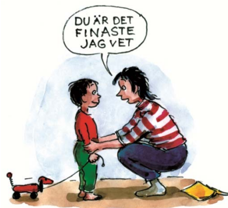
Bild från föräldrastödsprogrammet ABC. Illustration Cecilia Torudd

Flera av de kartläggningar som genomförts i projekten visar vikten av att fråga föräldrarna vilken form av föräldrastöd de önskar. Resultaten från utvärderingen av Triple P (Programmet för Positivt Föräldraskap) i Uppsalas projekt visar att gränssättning är något som föräldrar gärna vill diskutera och att de efter genomgången föräldrastödsutbildning är positiva till strategier som att berömma sitt barn, föregå med gott exempel, fastställa tydliga och grundläggande regler - istället för exempelvis eftergivenhet, som klassas som en ineffektiv fostransstrategi. Forskning visar att det är viktigt att man som förälder övar olika positiva strategier med sina barn.